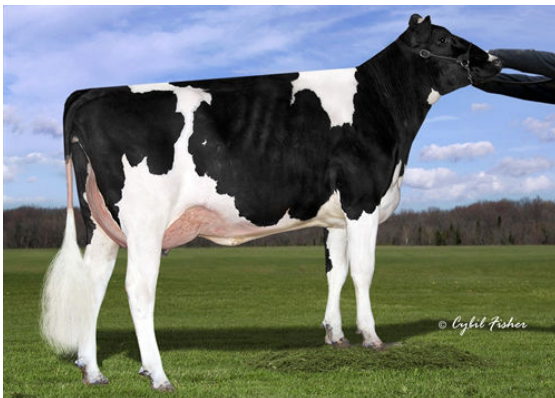
SIEMERS DENVER PARIS GRANDDAM